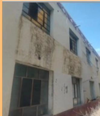
Vor der Renovation

Der Bau der Grundschule von GABU (Bezirk Jianzha ) war von der Stiftung im Jahr 2009 finanziert worden. Wegen den extremen Temperatur- und Feuchtigkeitsunterschieden in der Region zwischen dem sehr trockenen, extrem kaltem Winter und dem sehr heissen, feuchten Sommer wurde das Schulgebäude zunehmend arg in Mitleidenschaft gezogen. Die lokale Regierung sah sich jedoch leider nicht in der Lage, die Renovation des desolaten Gebäudes zu finanzieren, und bat deshalb die Stiftung um Hilfe. Der Stiftungsrat stimmte im Frühjahr 2023 einem schliesslich sinnvoll reduzierten Budget von CHF 18'300 zu. Nach einem eindrücklichen Endspurt seitens der Baufirma konnte der Unterricht zu Beginn des neuen Schuljahres anfangs September 2023 wieder aufgenommen werden.